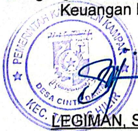
LEGIMAN, S. AP

Mengetahui Kepala Desa Cinta Damai Selaku Pemegang Kekuasaan Pengelolaan Keuangan Desa